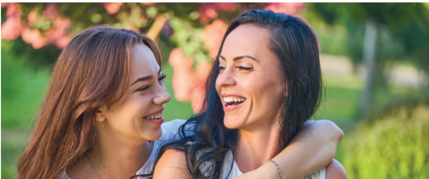
Partner und Kinder bleiben diesmal daheim, im Mädelsurlaub genießen mal ausschließlich Frauen eine gemeinsame Zeit.

MÄDELSURLAUB Viele Frauen fiebern schon weit im Voraus darauf hin