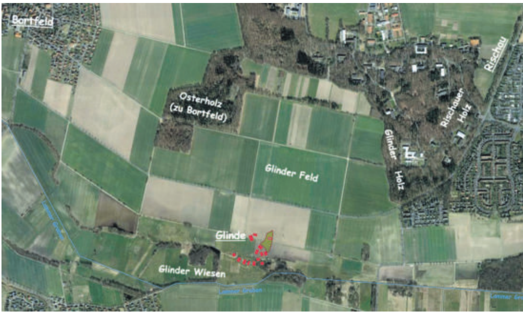
Ein Blick in die Feldmark. Dort, an der Verlängerung des Rodedammes, in einer feuchten Senke zwischen Lamme und Bortfeld, lag das Dorf Glinde.