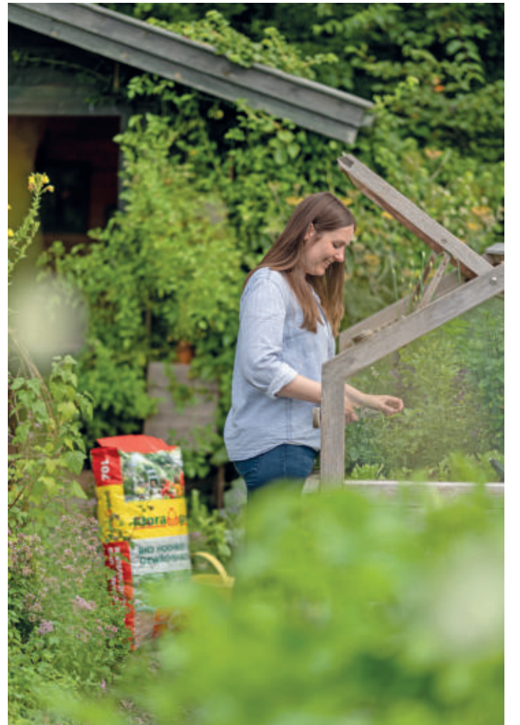
Neben der richtigen Pflanzenauswahl kommt es bei Hochbeeten insbesondere auf die Befüllung und auf eine hochwertige Erde an.

Neben den richtigen Pflanzen freuen sich Insekten zudem auch auf dem Balkon über ein Insektenhotel. Darin können sie nisten und sich zurückziehen. Insektenhotels gibt es in verschiedenen Größen. Sie sollten an einem sonnigen Ort aufgestellt oder aufgehängt werden, an dem sie vor Regen und Wind geschützt sind. Die Behausungen sind meist aus Holz, Kiefernzapfen und anderen natürlichen Materialien gefertigt. Wichtig ist, dass das Insektenhotel im Winter hängen bleibt. Sonst schlüpfen die Nachkömmlinge zu früh und sterben. Auch eine flache Trinkschale mit Steinen lockt Bienen, Schmetterlinge und Co. an und lädt sie zum Verweilen ein. So wird der städtische Balkon ohne viel Aufwand zum Insektenparadies.