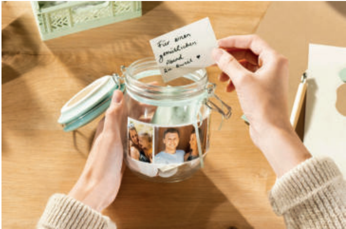
Mit einem Glas und einem Fotostreifen lässt sich ein Gutschein auf elegante Weise verschenken.

MUTTERTAG Individuelle Geschenke am 14. Mai