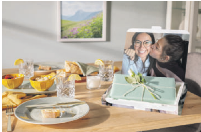
Mama ist einfach die Beste. Originelle Fotogeschenke sorgen am Muttertag für kleine Glücksmomente.

(DJD). Am 14. Mai 2023 ist Muttertag – und damit, abgesehen von den anderen 364 Tagen des Jahres, eine wunderbare Gelegenheit, um allen Mamas "Danke" zu sagen. Mit viel Aufmerksamkeit und persönlichen Geschenken können Kinder und Enkel ihre Mütter und Großmütter an diesem Tag feiern und rundum verwöhnen. Eine besondere Freude bereitet man Müttern mit Bildern von gemeinsamen Familienerlebnissen.