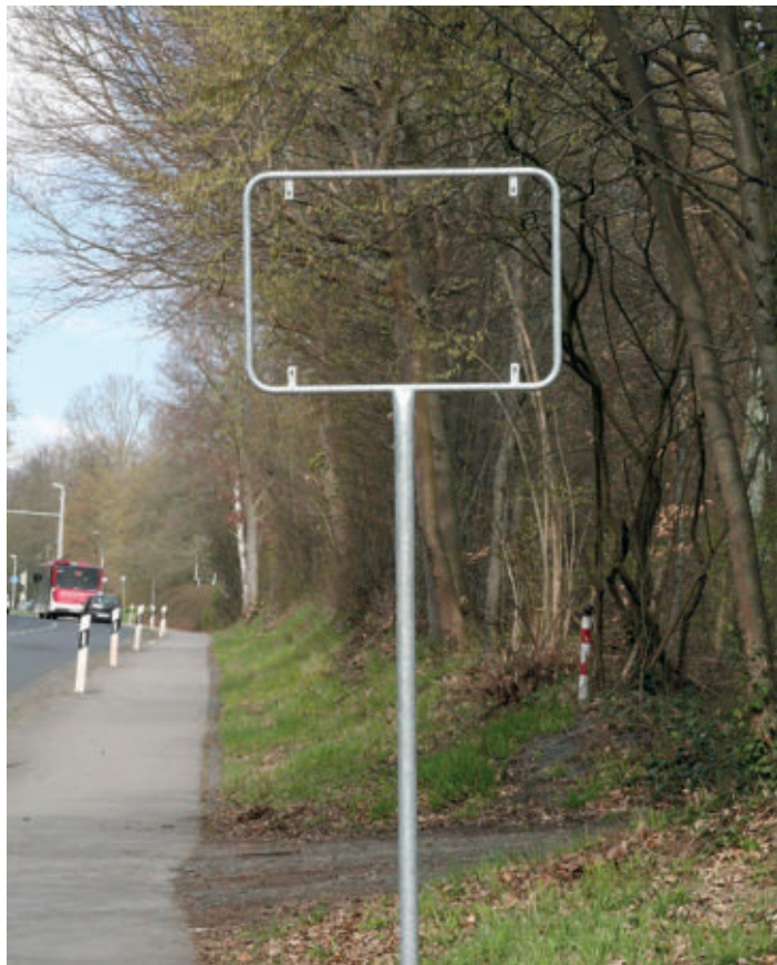
Verschwundenes Ortsschild Kanzlerfeld.