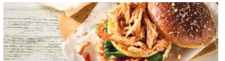
Geflügel bietet zahlreiche spannende Rezeptvarianten - wie den Pulled-Puten-Burger mit Ananas und Bacon.

REZEPTTIPP Sommerlicher Grillgenuss mit Geflügel