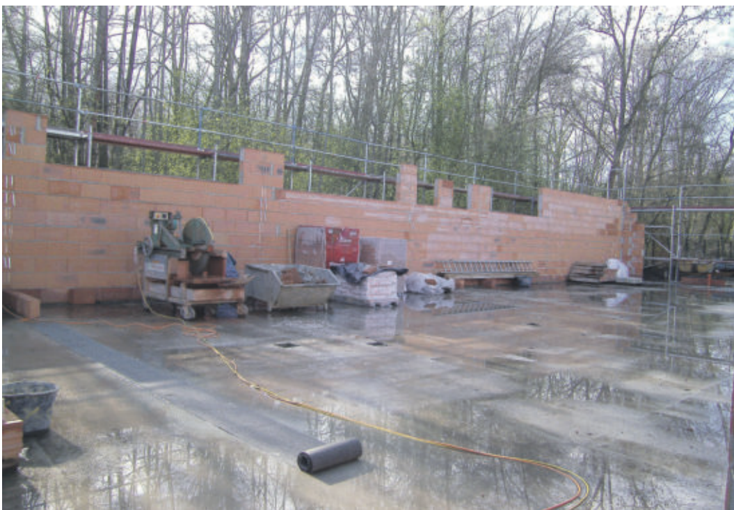
So sah der Neubau Ende März aus. Bis Redaktionsschluss der Rundschau waren zwar die Wände etwas höher geworden, das Dach fehlt jedoch noch.