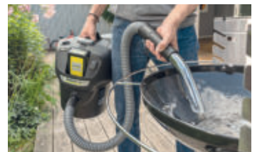
Wird mit Holzkohle gegrillt, kann die erkaltete Asche am nächsten Tag mit einem Aschesauger weitgehend staubfrei entfernt werden.

(DJD). Endlich starten wir wieder in die beliebte Grillsaison! Weniger beliebt ist allerdings das Säubern von Grill, Smoker oder Feuerschale. Doch wer lange Freude an seinen Grillgeräten haben möchte, sollte diese regelmäßig und sorgsam reinigen. Denn Fette, Ruß, Rückstände von Speisen und starke Hitze sorgen für hartnäckige und unappetitliche Ablagerungen, die zu einem schnelleren Verschleiß führen können.