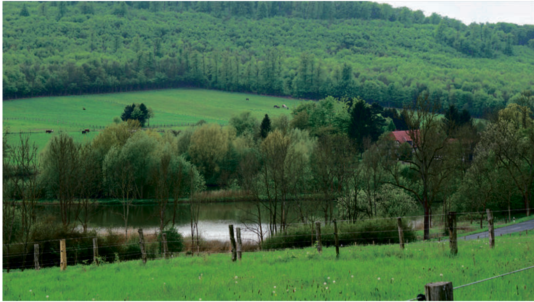
Blick ins Reitlingstal