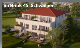
alle Grundrisse + Ausstattung individuell