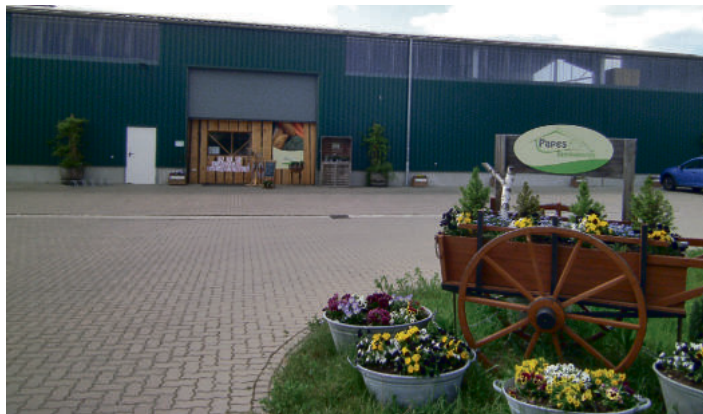
„Papes Gemüsegarten“ an der Neudammstraße in Lamme. Hier soll mittelfristig eventuell eine Wohnunterkunft für Erntehelfer entstehen.

LAMME Pape plant Unterkünfte für Erntehelfer