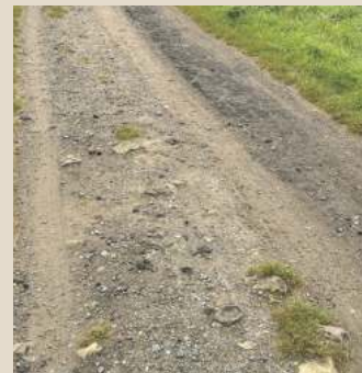
So sieht der städtische Teil des Eichenweges derzeit aus.

* wörtliche Wiedergabe, zum Teil in Auszügen