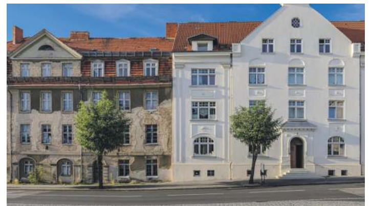
Nachdem der Grenzwert für Blei im Trinkwasser noch einmal gesenkt wurde, sind mögliche Sorgen über bleihaltiges Wasser künftig unbegründet.

TRINKWASSER: Die letzten bestehenden Bleileitungen müssen ausgetauscht werden