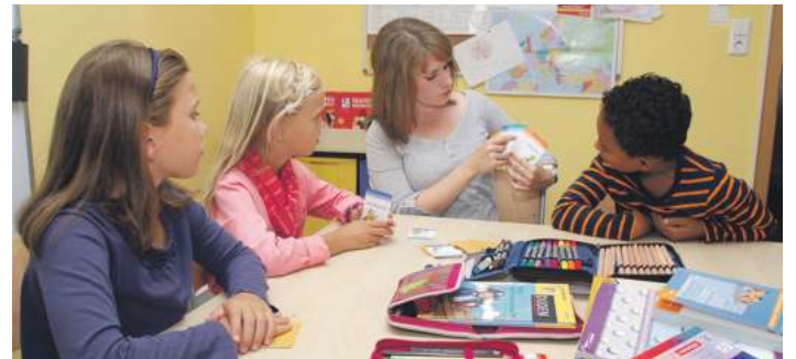
Wer eine Fremdsprache lernt, bringt oft mehr Verständnis für eine fremde Kultur auf.

UMFRAGE Mindestens zwei Fremdsprachen lernen