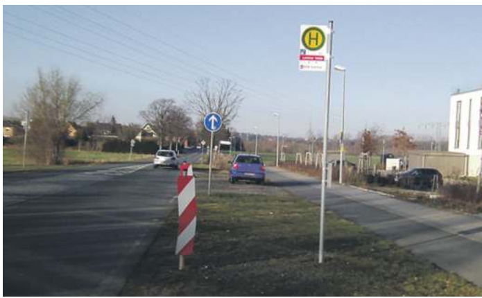
Foto Bushaltestelle Lammer Heide

„Der Stadtbezirksrat 321 hat immer deutlich gemacht, dass für den Bolzplatz, der durch den Neubau „Görge-Markt“ entfällt, gleichwertiger Ersatz geschaffen werden muss [...] Dies ist von der Verwaltung mehrfach zugesagt worden. [...] Der Stadtbezirksrat hat am 25.11.2021 [...] der Planung der Verwaltung zur Anlage eines öffentlichen Jugendplatzes im Domagkweg zugestimmt. In der Antwort der Verwaltung auf die Anfrage der Fraktion B90/Die Grünen [...] vom Januar 2023 weist die Verwaltung darauf hin, dass durch verschiedene rechtliche Prüfungen, die durch Anwohnerbeschwerden notwendig geworden sind, es zu erheblichen zeitlichen Verzögerungen gekommen ist. Die Verwaltung geht davon aus, dass durch die bereits vorgebrachten Beschwerden erwartet werden kann, dass nach Vorliegen der Baugenehmigung weitere Einwände vorgebracht bzw. rechtliche Schritte gegen den Bau des sogenannten Jugendplatzes eingeleitet werden. Die Verwaltung sah sich außerstande, einen Zeitplan für die Realisierung des Jugendplatzes anzugeben. Vor diesem Hintergrund müssen rechtzeitig alternative Planungen konkretisiert werden, damit ein Raum für Jugendliche im Kanzlerfeld geschaffen wird. Dies kann die Fläche „Südlich Oscar-Fehr-Weg“ sein. Dieser Standort war von der Stadt ebenfalls geprüft worden, wäre grundsätz-