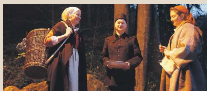
Sie nehmen die Gäste mit auf eine Laternenreise – Harzer Bergmann und Grundner Kiepenfrau

Einer der spannendsten Harzer Naturschätze, die Iberger Tropfsteinhöhle, liegt an der Harzhochstraße oberhalb der Bergstadt Bad Grund. Sie ist Teil des HöhlenErlebnisZentrums, wie auch das archäologische Museum, das einer bronzezeitlichen Kulthöhle im Harzer Vorland gewidmet ist. Die eng mit der Sagenwelt des Harzes verbundene Tropfsteinhöhle findet sich verborgen im Kalkgestein des Ibergs und zeigt jahrhunderttausende alte Sinterkaskaden, mächtige Bodentropfsteine und bizarre Deckenkolke – Höhlenfeeling inklusive.