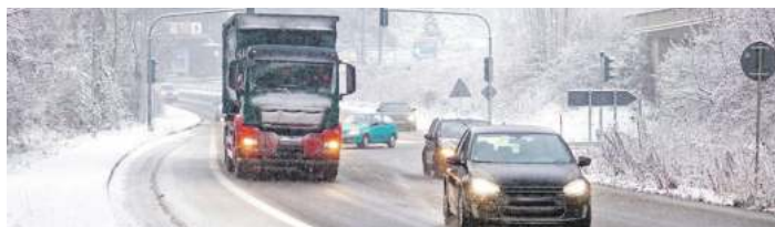
Mit Reifglätte, überfrierender Nässe und Schnee müssen Autofahrer im Winter jederzeit rechnen.

Maßgeblich zur Sicherheit im winterlichen Straßenverkehr trägt der Winterdienst bei. Sobald Schnee fällt oder