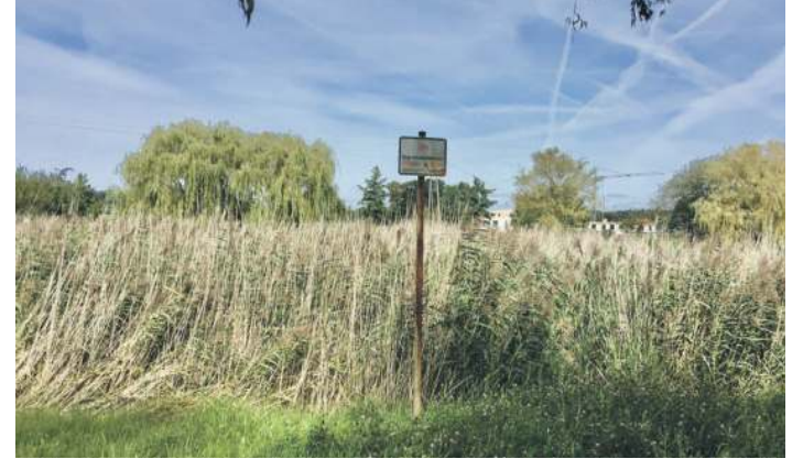
So wie hier in Lamme sehen einige Regenwasserrückhaltebecken aus. Kaum als solche zu erkennen, aber voll funktionsfähig.

Die Verwaltung teilte Folgendes mit*: „Das Regenrückhaltebecken am Ortsausgang Lamme in Richtung Wedtlenstedt wird durch die SEJBS regelmäßig unterhalten. Im Rahmen der Unterhaltung wird das Becken mindestens 1 x pro Monat angefahren und auf Funktionsfähigkeit,