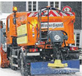
Der Winterdienst mit Feuchtsalz trägt maßgeblich zur Sicherheit im Straßenverkehr bei.

SICHERHEIT Guter Winterdienst und richtiges Fahrverhalten