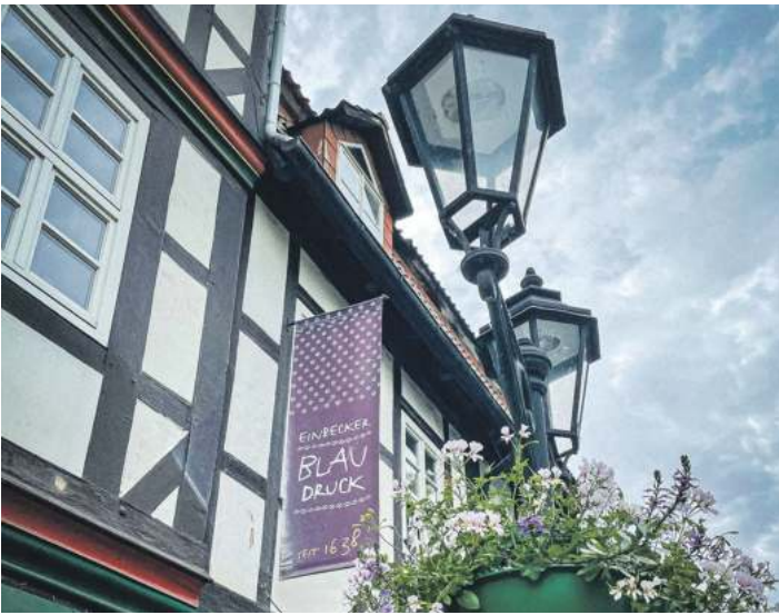
In Einbeck befindet sich Europas äteste Blaudruckerei.

DO IT YOURSELF: Blaudruck, Porzellanmalerei und Ostfriesentee