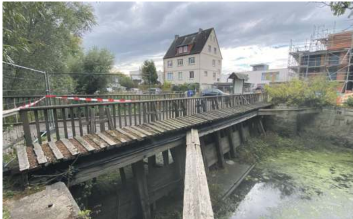
Das Ölper Mühlenwehr, so wie es 2020 aussah und immer noch aussieht.