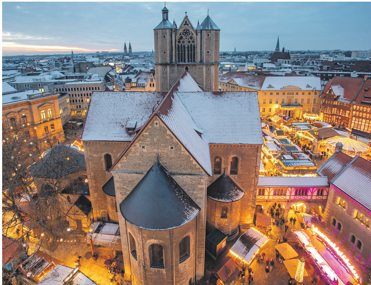
Gebrannte Mandeln, Glühwein und Handwerkskunst: Der Braunschweiger Weihnachtsmarkt lädt im Dezember mit 140 Ständen in die Braunschweiger Innenstadt ein.

BRAUNSCHWEIG Vielfältige Veranstaltungen im Dezember